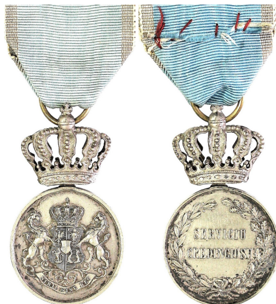
Medalia „Serviciul Credincios” clasa a II-a (avers și revers).

(avers) poartă, în relief, armele țării, iar pe partea opusă (revers), sunt stampate, tot în relief, cuvintele: SERVICIUL CREDINCIOS, înconjurare de câte o ramură de stejar și de laur, care se unesc printr-o fundă. La partea superioară a Medaliei este coroana regală și un inel prin care se trece panglica. Panglica este de moar albastru-de-schis, cu câte o dungă de fir argintiu pe fiecare margine, panglica lată de 35 mm și lungă, în partea aparentă, de 50 mm și se fixează pe piept în toată lățimea ei, adică fără alte îndoituri decât cele de la extremități, de care, pe de o parte, se atârână Medalia de panglică, iar pe de altă parte, panglica de piept, căpătâiele panglicii prinzându-se cu copci dedesubt”.