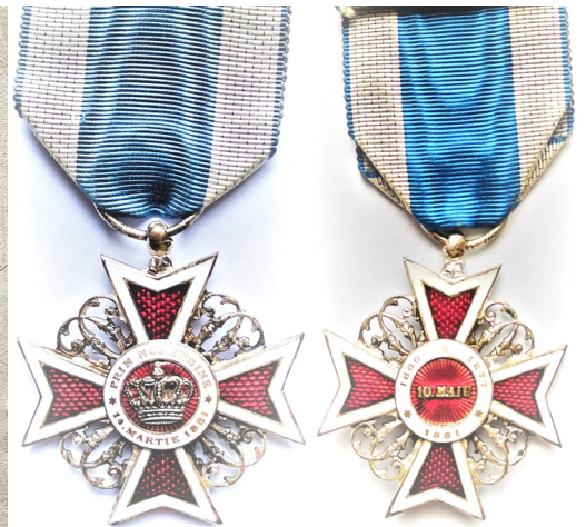
Ordinul „Coroana României” în gradul de Cavaler, model 1881 (avers și revers).

Decretul regal nr. 4.533 din 14 iunie 1913 (prima pagină).